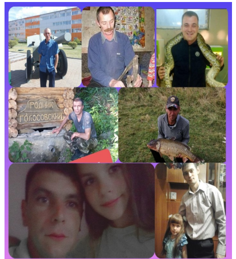
Папы обучающихся 5 класса

праздник, в который хочется напомнить, что отец испокон веков и до нынешнего времени был и остается главой любой семьи. В этот день мы желаем нашим отцам нерушимого и крепкого, как алмаз, здоровья, большой